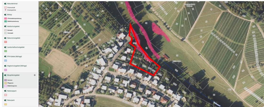
Abb. 2: Auszug aus den online Umwelt- und Karten-Daten des Umweltinformationssystems (UIS) der Landesanstalt für Umwelt, Messungen und Naturschutz Baden-Württemberg (LUBW); Internetabfrage vom 29.08.2023

Im Plangebiet liegt teilweise das Offenlandbiotop „Feldgehölz am Ostrand von Nesselried (Biotopnummer 174143173525). Das Biotop wird im zeichnerischen Teil dargestellt und gesichert. Eingriffe in das Biotop dürfen nur mit vorheriger Abstimmung und ggfls. Genehmigung der unteren Naturschutzbehörde erfolgen.